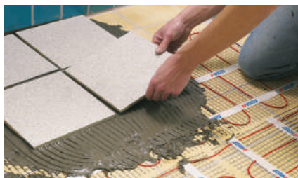
13. Установка плитки*

* Альтернативным методом монтажа является заливка разложенного мата самовыравнивающимся раствором (слой толщиной 5–10 мм), а затем укладка плитки или иного напольного покрытия на этот слой с использованием необходимых адгезионных слоев.