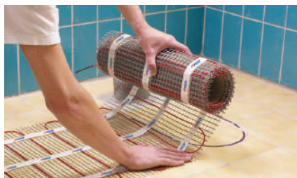
8. Раскладка мата