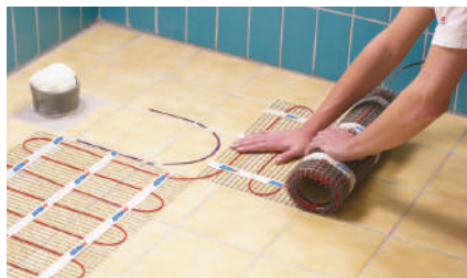
10. Обход препятствия