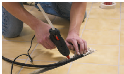
7. Фиксация гофротрубки