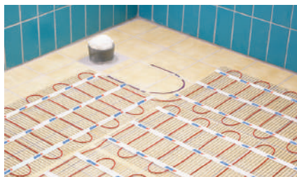
11. Продолжение укладки мата