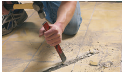
5. Штробление канала и установка гофротрубки для датчика