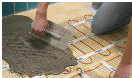
12. Затирка плиточным клеем