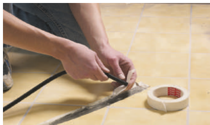
6. Необходимо заглушить отверстие в гофротрубке любым подходящим способом